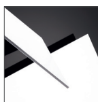
PLATINWEISS – MATT | HOCHGLANZ