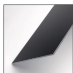
TIEFSCHWARZ – MATT | HOCHGLANZ

DIBOND® FR ist ab sofort auch in 2050 mm Breite erhältlich. Bislang gab es das Produktportfolio von DIBOND® FR nur bis zu einer Breite von 1500 mm. Ab sofort können die von DIBOND® bekannten Standardfarben sowohl in der Oberflächenkombination matt/matt als auch in matt/hochglanz bis zu einer Breite von 2050 mm in der Ausführung "schwer entflammbar" geliefert werden. Für Sonderfarben sprechen Sie uns gerne an.